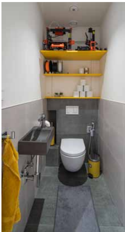
Polici na toaletě zaujímá 3D tiskárna, na níž Honza vyrobil řadu užitečných dílů nejen pro vzduchotechniku.

například speciální vyústky a klapky pro vzduchotechniku. Stejně si vytvořil i plastový stojan na květináče, úchytky nebo speciální díl vyrovnávající vypsávanou podlahu a dveře do sprchového koutu.