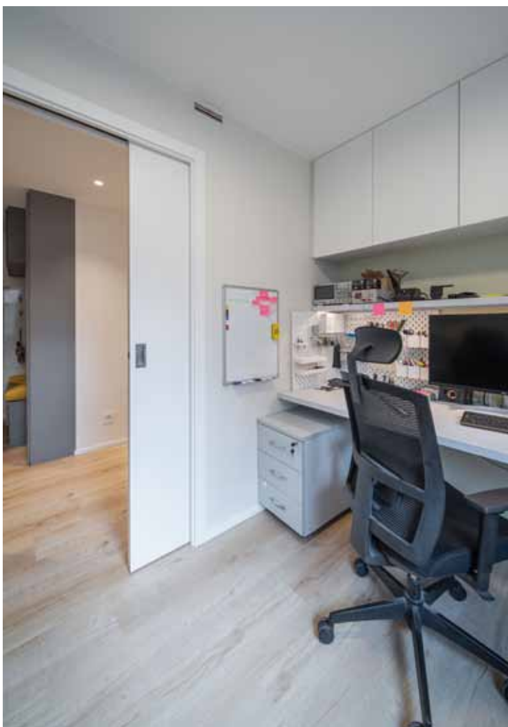
V pracovně každý z partnerů využívá vlastní psací stůl a nad ním úložné skříňky.