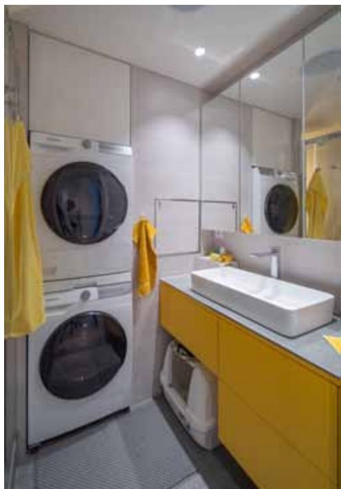
Malá koupelna zařízená na míru pojala i pračku se sušičkou a kočičí WC. Proti umyvadlu je sprchový kout.