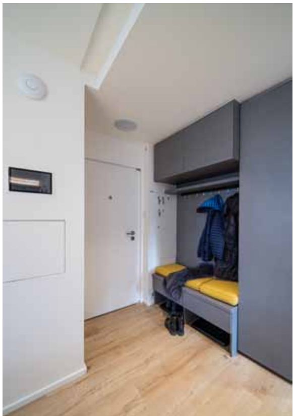
Věšákovou stěnu vedle vstupu nechala Gabriela vyrobit z materiálu Kronospan s šedou plátěnou texturou.