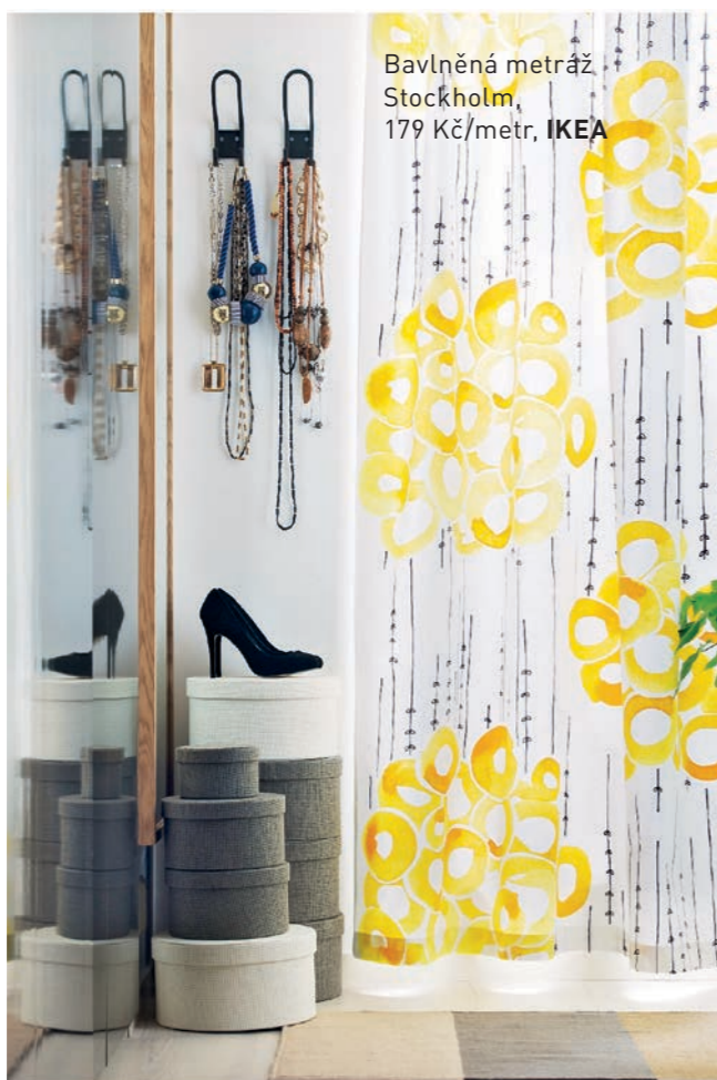
Bavlněná metráž Stockholm, 179 Kč/metr, IKEA

Jednou z výhod internetu je, že dnes se můžete naučit šít, aniž byste opustila byt. On-line kurzů je spousta a díky návodným videím z vás brzy jistě budou zručné švadlenky (onlineskolasiti.cz, kurzysiti-online.cz, kurzyhned.cz a další).