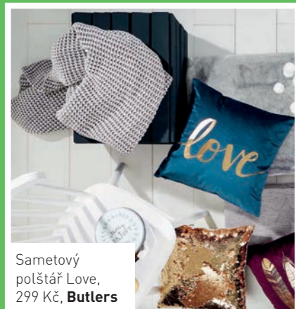
Sametový polštář Love, 299 Kč, Butlers