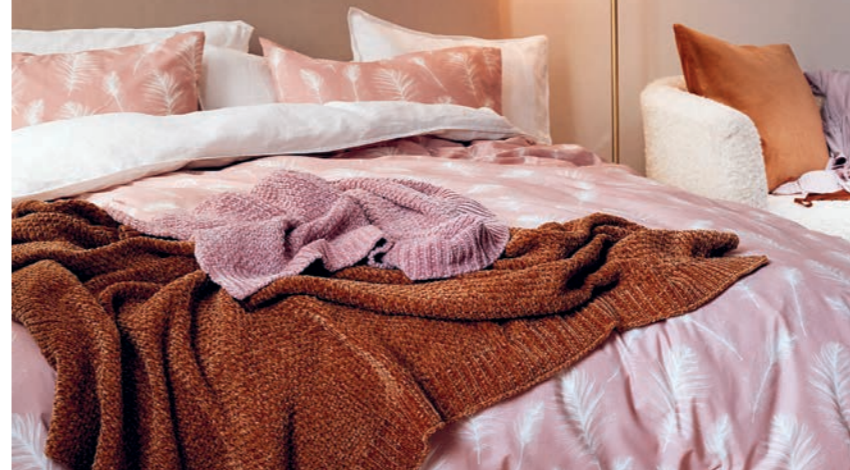
Pléd z žinylkové příze, 999 Kč, H&M Home

Ložní prádlo by nemělo příliš podléhat barevným trendům, respektive ne těm divokým, v nichž by se vám mohly zdát špatné sny. Povlečení volte z prodyšných příjemných materiálů v tlumené klidné barevnosti. A nezapomeňte na měkké a hřejivé přehozy a plédy.