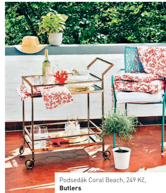
Podsedačka Coral Beach, 249 Kč, Butlers

Zejména obdivovatelé boho stylu sáhnou při koupi textilních doplňků po těch lněných. Len je stále v kurzu a jako přírodní materiál se používá nejen na ubrusy, polštářky a plědy, ale i na ložní prádlo.