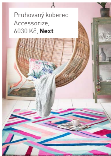
Pruhovaný koberec Accessorize, 6030 Kč, Next

Nejjednodušší možností, jak změnit vzhled interiéru, je vyměnit polštářky na pohovce, křeslech a třeba i na posteli. Momentálně jsou trendy povlaky pletené, s kovovým leskem, s nápisy či třpytkami.