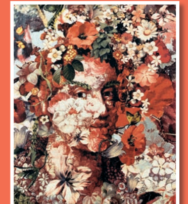
Tapeta inspirovaná složenými hlavami Arcimbolda.