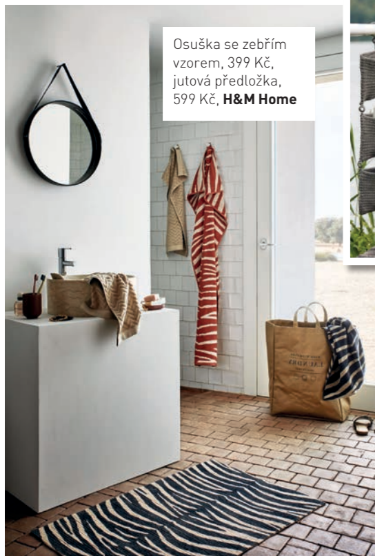
Osuška se zebřím vzorem, 399 Kč, jutová předložka, 599 Kč, H&M Home