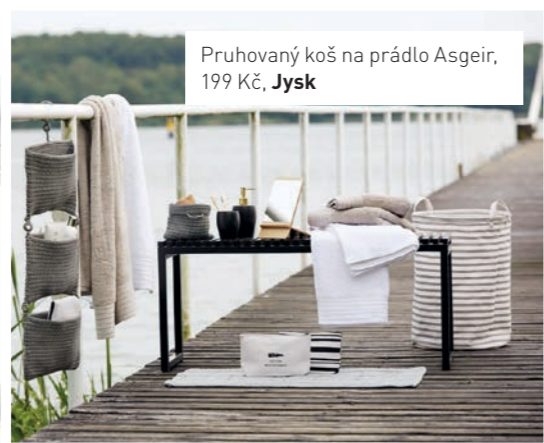
Pruhovaný koš na prádlo Asgeir, 199 Kč, Jysk