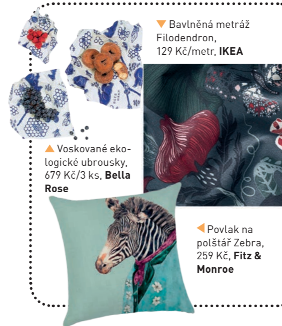
▼ Bavlněná metráž Filodendron, 129 Kč/metr, IKEA