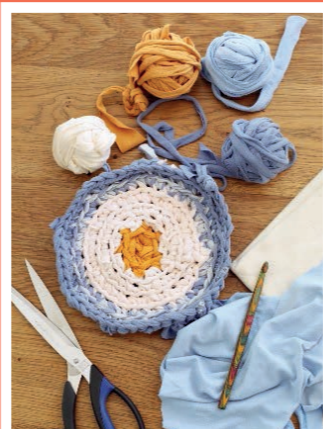
Ze starých rozstříhaných triček si připravíte „přízi“.