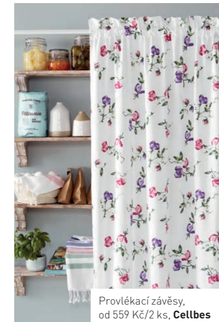
Provlékačí závěsy, od 559 Kč/2 ks, Cellbes