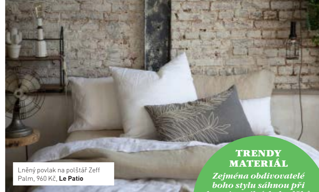
Lněný povlak na polštář Zeff Palm, 960 Kč, Le Patio

I ten nejstudenější interiér zútulní kusový koberec. Ve strohém bytě se dokonce takový originální soliterní kousek může stát uměleckým dílem, které je místo na stěně umístěné na podlaze. Jen pozor na ostatní textil, aby se vzory netloukly.