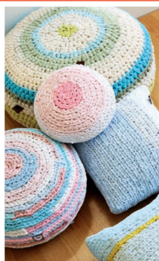
Nakonec spojte místo, kudy jste vložili výplň, a je hotovo!