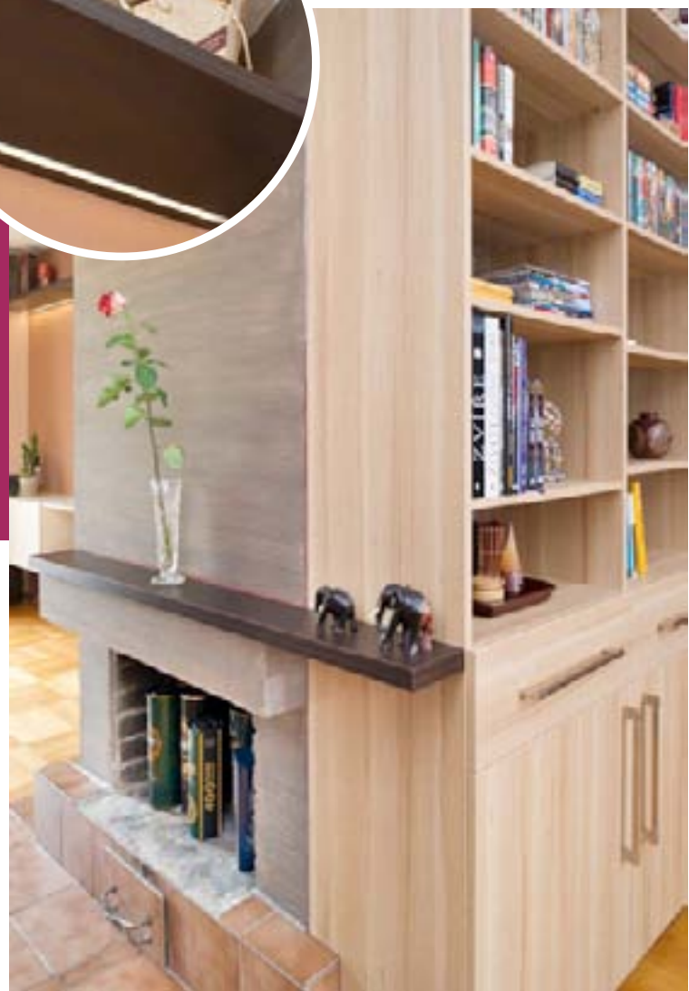
HNED vedle krbu stojí knihovna, která patří do pracovní části. Bok knihovny navazuje přímo na krb, tomu dopomáhá i polička na římsě, jež vede až na skříněku.