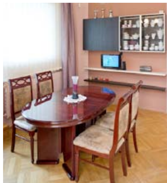
NA STĚNĚ poblíž jídelního stolu je zavěšena sestava skříněk, která slouží na vystavení sbírky porcelánu a skla.