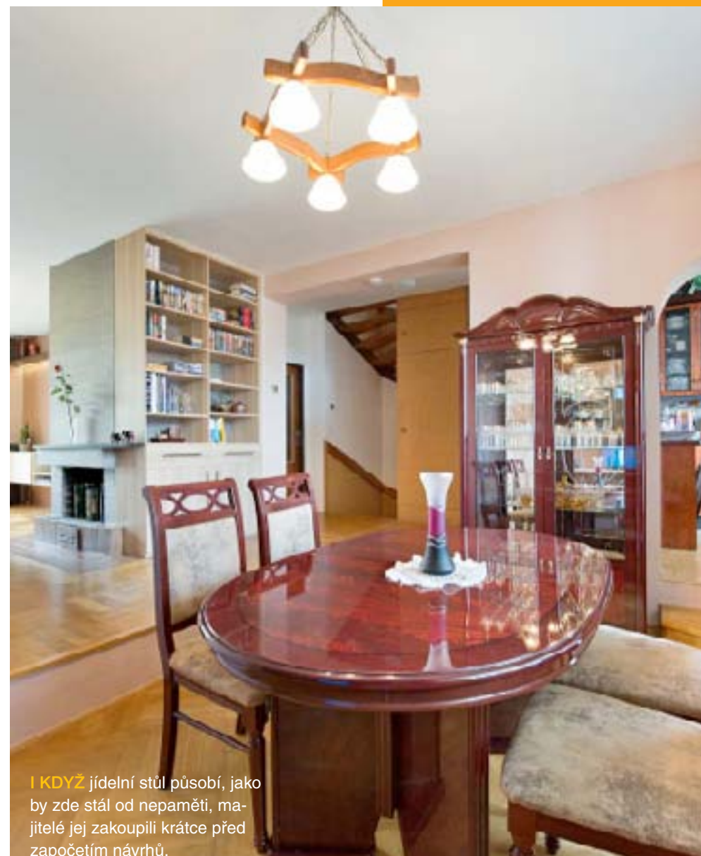
KDYŽ jídelní stůl působí, jako by zde stál od nepaměti, majitelé jej zakoupili krátce před započítím návrhů.