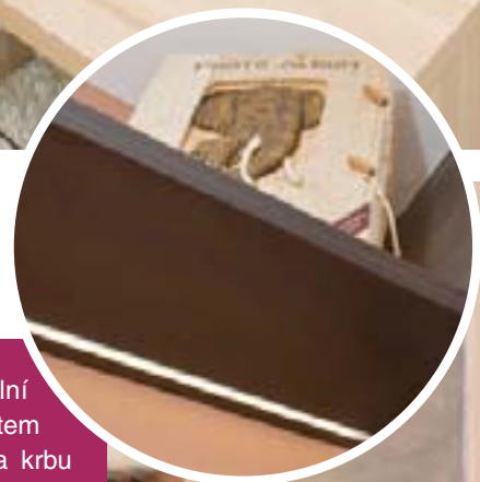
SUVENÝRY z cest se objevují téměř na každém kroku.

bylo nutno přizpůsobit stávající parketové podlaze a nábytku, který zde musel zůstat – jídelnímu setu se skleníkem v dekoru třešně ve vysokém lesku. Volba padla na kombinaci hnědé a jemné fialkové barvy. Protože v místnosti bylo použito množství různých materiálů, ladili se stěny spíše v neutrálních barvách. Zajímavostí je druh výmalby, který vyniká speciálními povrchy a strukturami. Na zdi za sedačkou