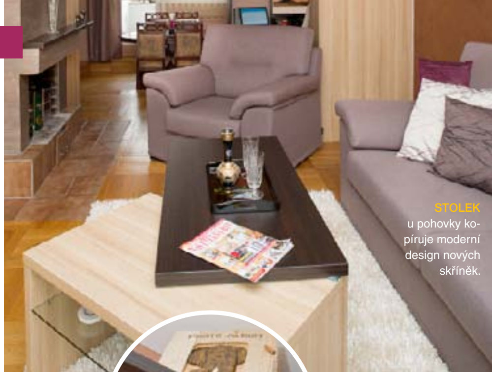
STOLEK u pohovky kopíruje moderní design nových skříněk.