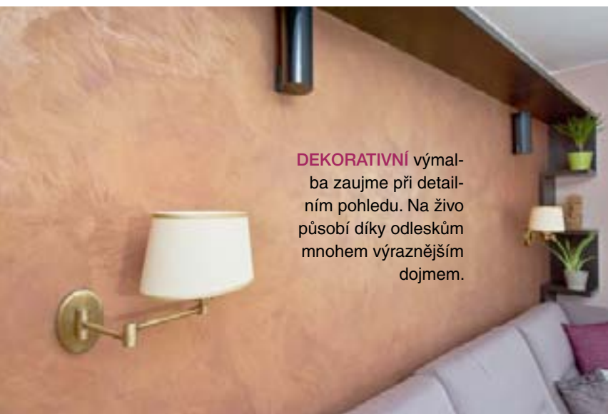
DEKORATIVNÍ výmalba zaujme při detailním pohledu. Na živo působí díky odleskům mnohem výraznějším dojmem.