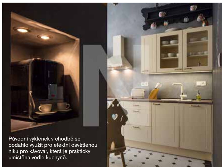
Původní výklenek v chodbě se podařilo využít pro efektní osvětlenou niku pro kávovar, která je prakticky umístěna vedle kuchyně.