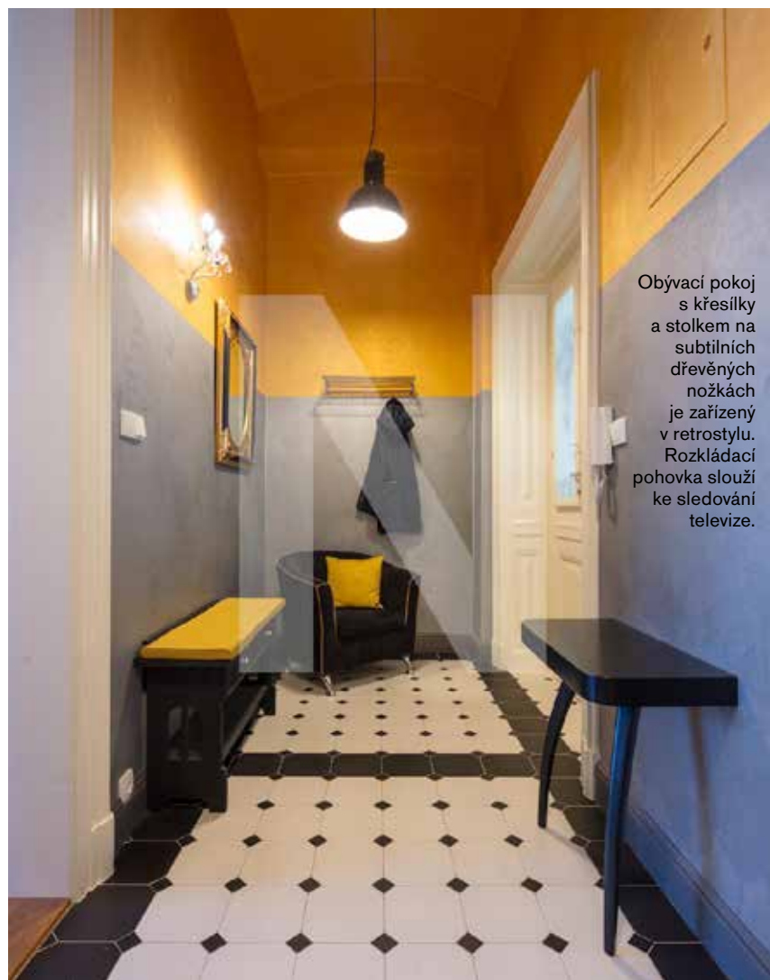
Obývací pokoj s křesílky a stolem na subtilních dřevěných nožkách je zařízený v retrostylu. Rozkládací pohovka slouží ke sledování televize.