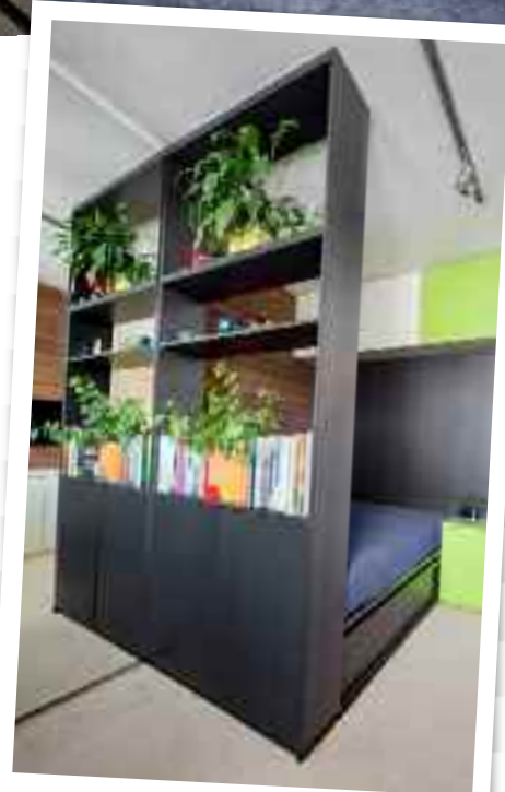
Regál má dole úložný prostor a nahoře police na knížky i na vystavení fotografií sportovních idolů nadějného mladého floorbalisty.

Byt není nijak velký, ale díky novému uspořádání se povedlo každý kousek místa účelně využít a vytvořit příjemné bydlení pro aktivní rodinu. „Ještě nás čeká předělat koupelnu, ale teď si rádi od budování oddecháme,“ prozrazuje sympatický majitel bytu plány do budoucna za tichého souhlasu černé fenky, která je miláčkem rodiny. 🐾