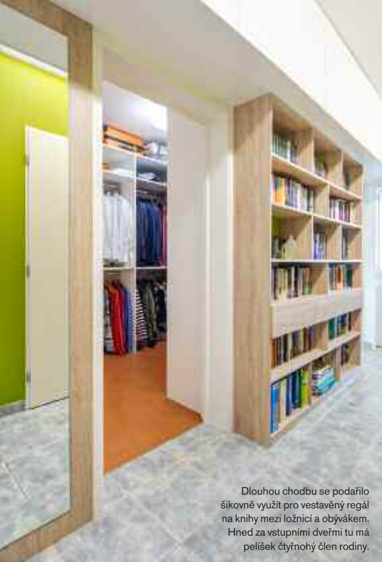
Dlouhou chodbu se podařilo šikovně využít pro vestavěný regál na knihy mezi ložnicí a obývkem. Hned za vstupními dveřmi tu má pelíšek čtyřnohý člen rodiny.

Ložnici rodičů od chodby odděluje velkorysá otevřená šatna. Za postelí je dřevěný obklad z masivní borovice a na stěně vedle lůžka jemně vzorovaná tapeta.