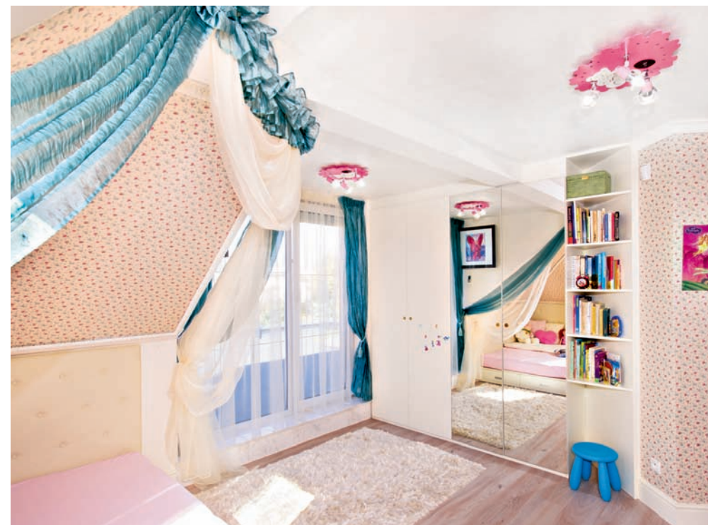
▲ ZRCADLOVÁ plocha na vestavěné skříni opticky zvětšuje prostor pokoje, který má komplikované tvary.