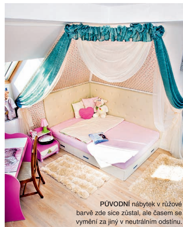
PŮVODNÍ nábytek v růžové barvě zde sice zůstal, ale časem se vymění za jiný v neutrálním odstínu.