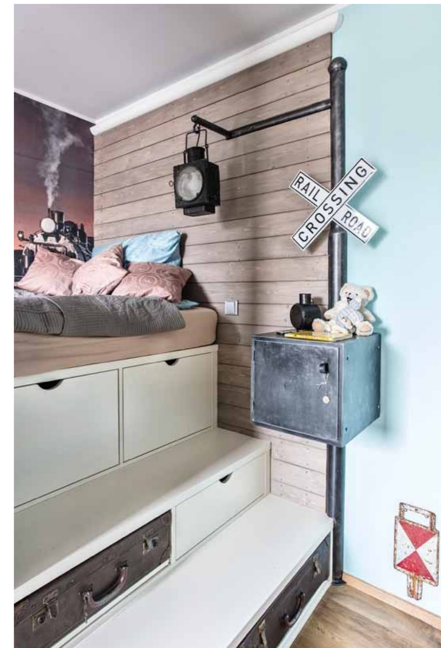
▲ Promyšlená je i povrchová úprava stěn a dveří, které jsou obloženy dřevem v duchu starého železničního vagonu.

Také tato nová část zařízení určitě stojí za zmínku. Na první pohled, ale hlavně na první posezení, je zřejmé, že jde o kvalitní a bytelný kus nábytku. „Dala jsem na radu Gábiny a investovala do kvalitní sedací soupravy, která by měla dobře sloužit mnoho let. A mám radost z toho, jak jsme ji pak společně dotvořily,“ ukazuje mi Tereza originální polštáře, jejichž potahy jsou dílem ši-