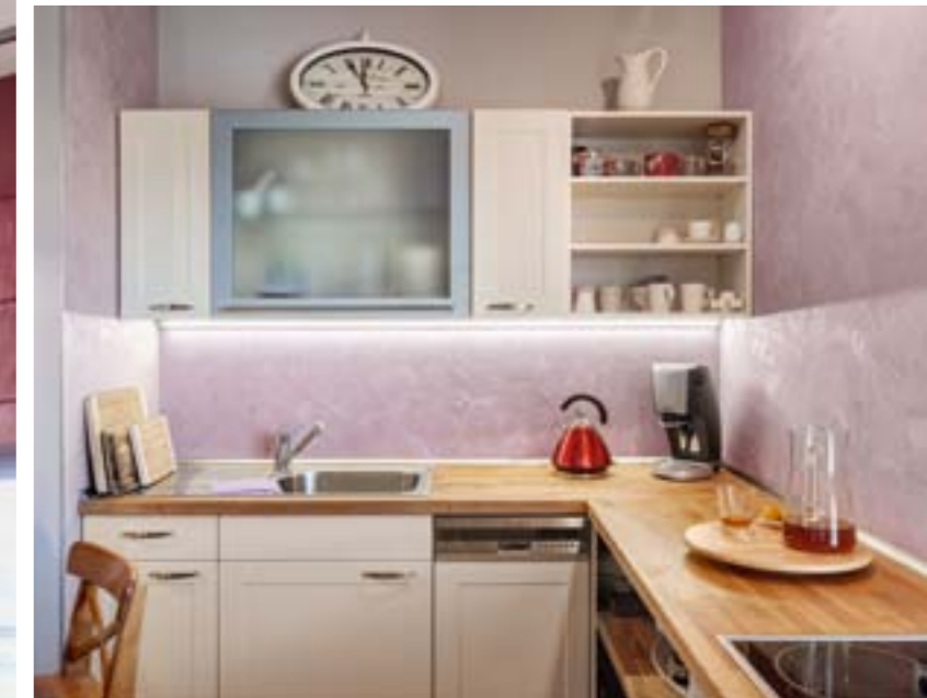
KUCHYŇ S JÍDELNÍM KOUTEM – nové prostornější řešení, v němž zůstal původní nábytek a spotřebiče. Pracovní deska je z dřevěné olejem napařené spárovky, na stěnách je stěrka „magic touch“. Osvětlení vyřešené pomocí ramp, reflektorů a zavěšených lamp z bazaru, na okno vybrala designérka římskou roletu.